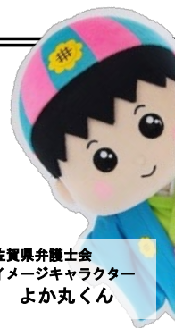
佐賀県弁護士会 イメージキャラクター よか丸くん